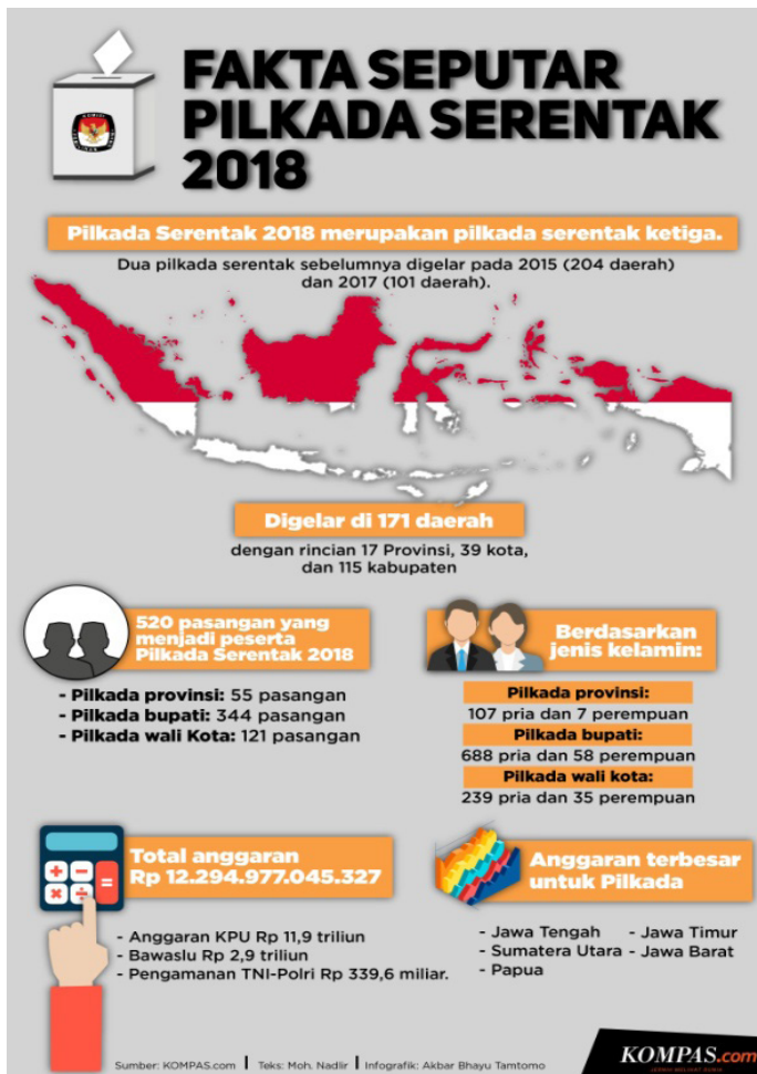
Gambar 2. Infografis Fakta Seputar Pilkada Serentak

langsung, juga bukan persoalan dilaksanakan secara serentak atau tidak. Ada banyak hal yang mesti dipertimbangkan dan tawaran tentang Pilkada asimetris dengan kondisi Indonesia yang masih membutuhkan konsolidasi demokrasi di tingkat lokal dengan meninjau kembali seluruh regulasi baik regulasi Pilkada, regulasi otonomi daerah dan regulasi partai politik.