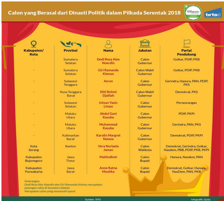
Gambar 4. Infografis Calon dengan Latar Dinasti Politik pada Pilkada 2018

politik dinasti menghasilkan kepemimpinan yang tidak stabil.