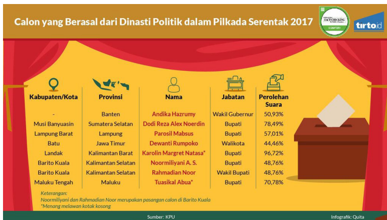
Gambar 3. Infografis Calon dengan Latar Dinasti Politik pada Pilkada 2017

mengeliminir rezim yang ada, karena di seluruh lini, tergerus oleh kekerabatan yang saling mengikat satu dengan lainnya. Contoh yang paling kuat adalah Dinasti Ratu Atut di Banten, yang menjebak di banyak Kabupaten/Kota di wilayah Banten. Ratu Tatu Chasanah yang merupakan adik dari mantan Gubernur Banten, Ratu Atut Chosiyah, yang berhasil memenangkan Bupati Serang pada 2016 lalu, menjadi fakta nyata bahwa dinasti politik terbentuk karena peluang kemenangan yang lebih tinggi ketimbang pasangan kandidat lainnya.