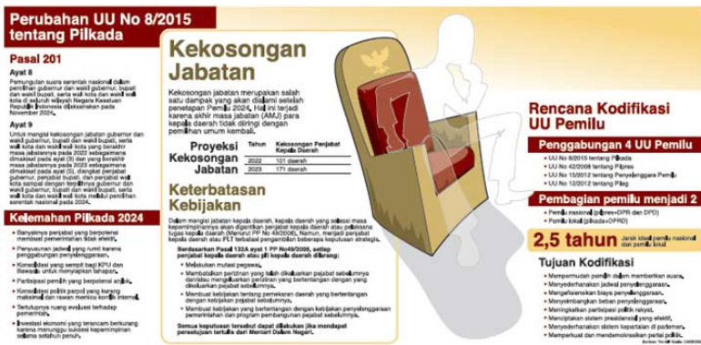
Gambar 1. Infografis Desain Pilkada Serentak